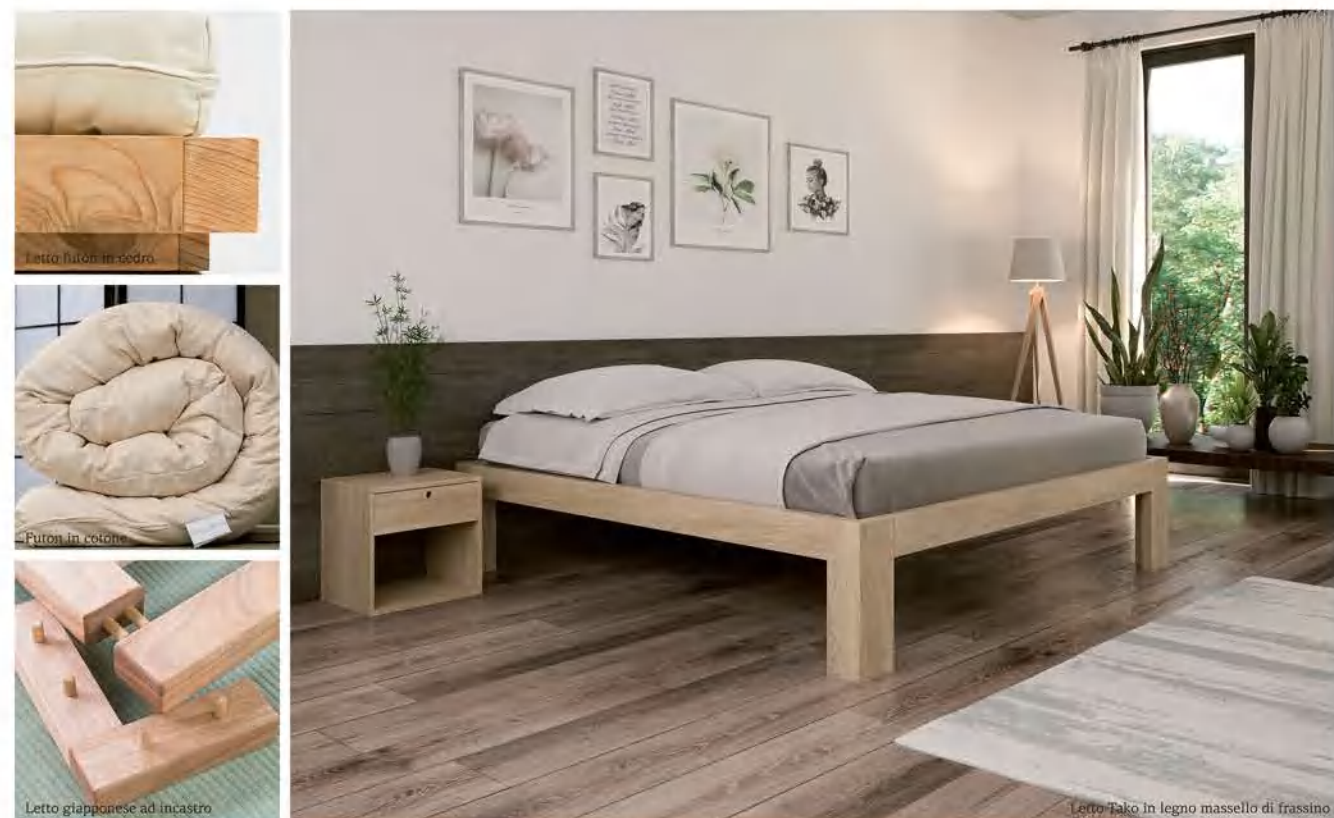
Letto futon in seta