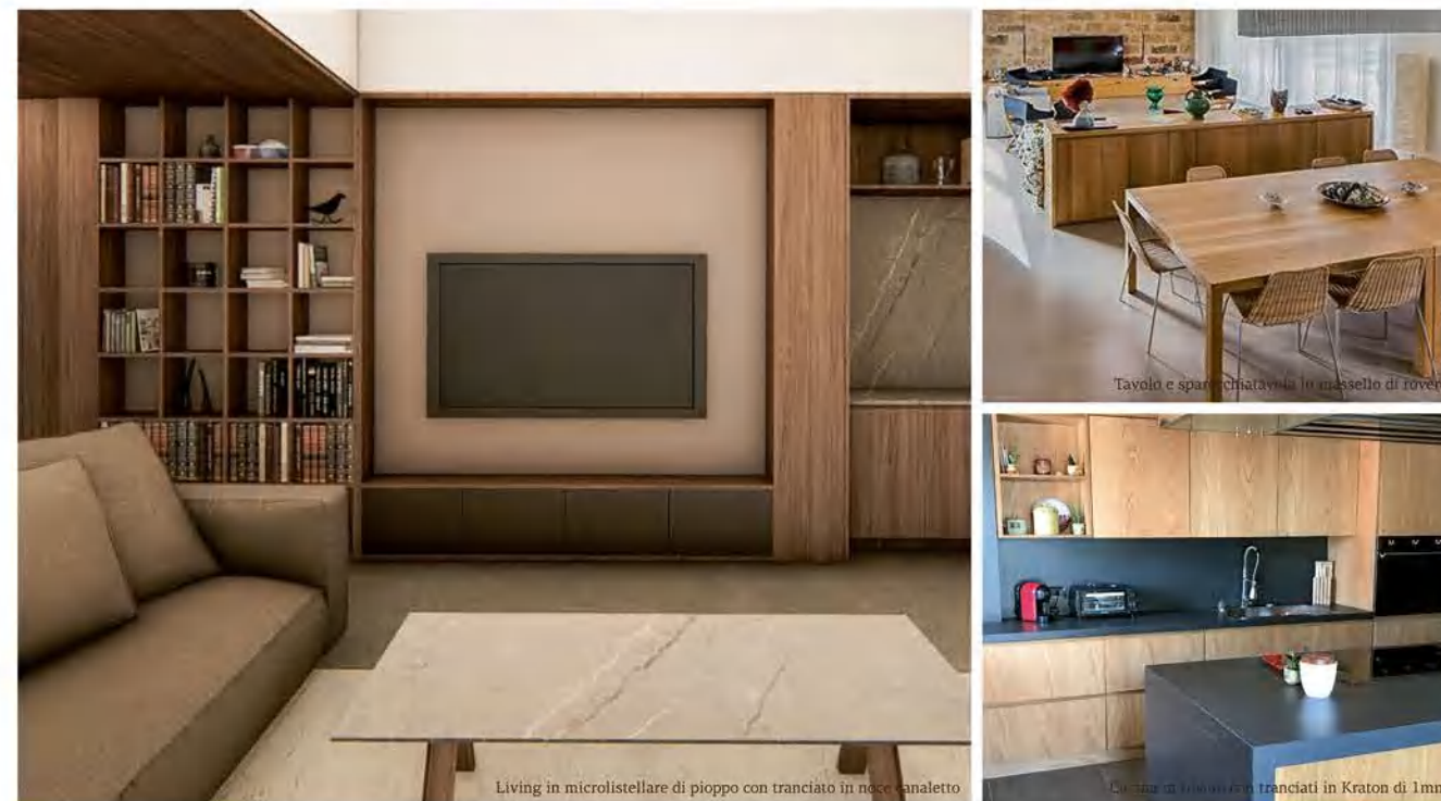
Living in microlistellare di pioppo con tranciato in noce canaletto

Unire sostenibilità, artigianato e innovazione è possibile.